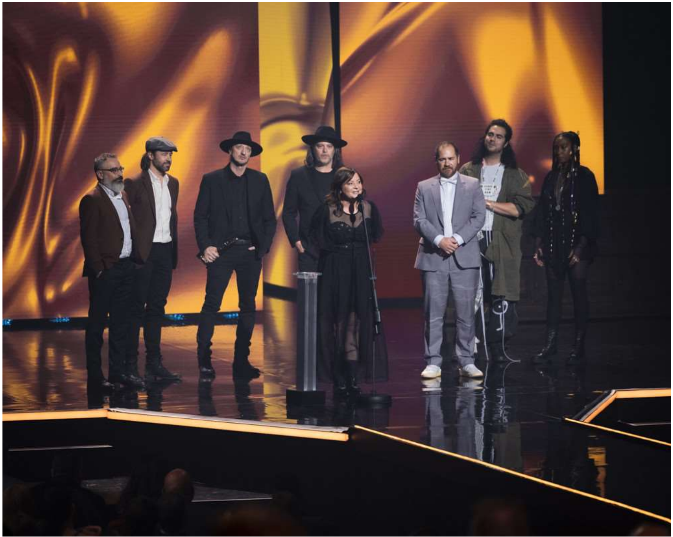
Le groupe lors du Gala de l'ADISQ en 2024.

L'annonce s'inscrit dans la tendance croissante des films de type « concert-événement », qui connaissent un succès notable ces dernières années. Parmi les exemples récents figurent Taylor Swift: The Eras Tour (2023), Queen Rock Montreal (2024) ou encore le Central Tour au cinéma (2022), qui proposait une immersion dans la tournée du groupe français Indochine.